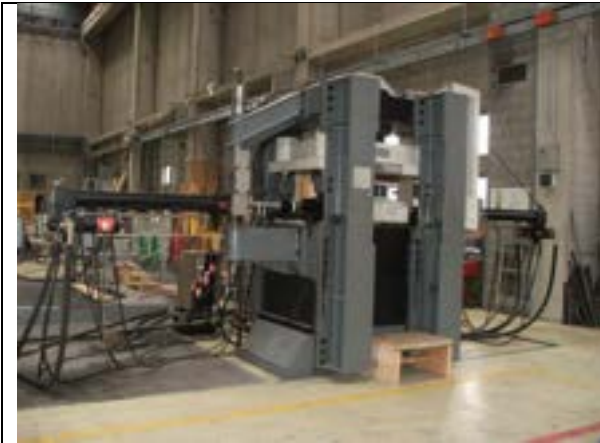
Attrezzatura di prova