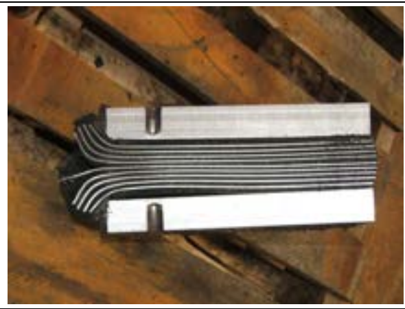
Isolatore prima e dopo la prova di carico verticale e sua sezione