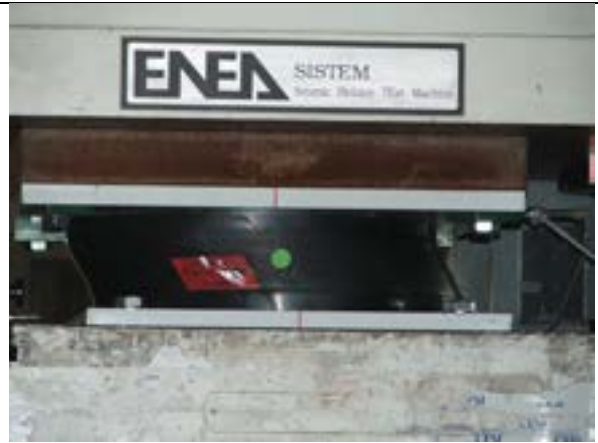
Isolatore in prova