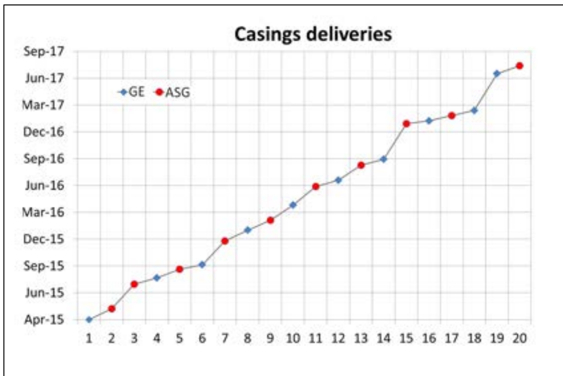
Figura 7: Completamento delle attività: 20 casse consegnate ad agosto 2017.