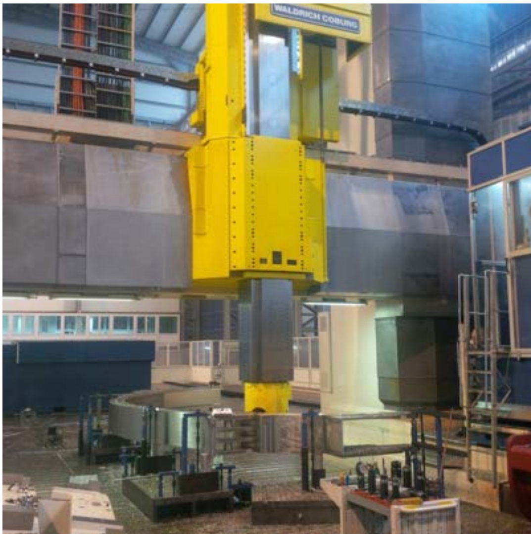
Figura 3: Lavorazioni di macchina sulla parte esterna della gamba curva nello stabilimento della ditta Walter Tosto a Ortona.