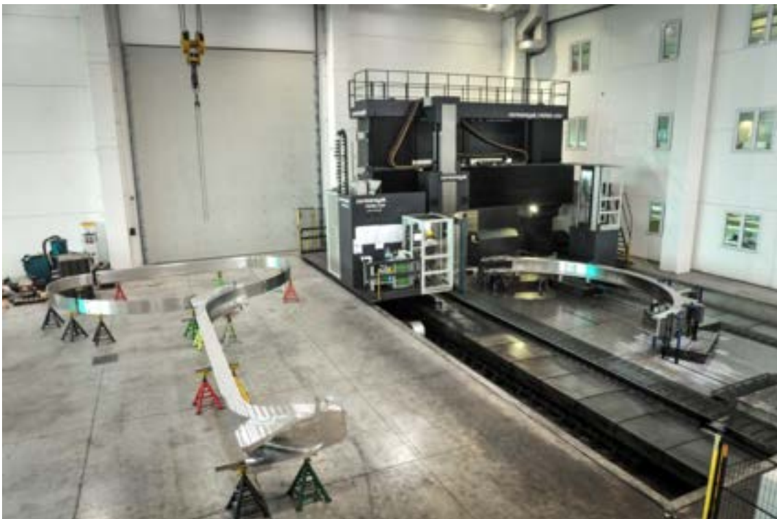
Figura 1: Componenti di una cassa di contenimento delle bobine toroidali di JT-60SA nelle officine della ditta Walter Tosto a Chieti.

La produzione delle 2 casse rimanenti delle diciotto previste dal contratto originario e delle due casse aggiuntive per le bobine spare è stata completata entro agosto 2017, secondo la progressione di consegne mostrata in Figura 7.