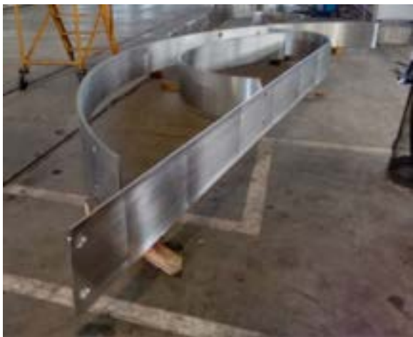
Figura 4: Covers.