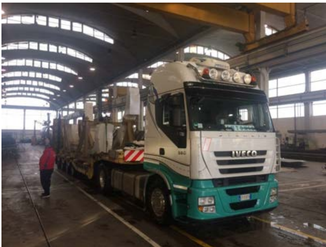
Figura 6: Trasporto dei componenti della sedicesima cassa su un unico camion.