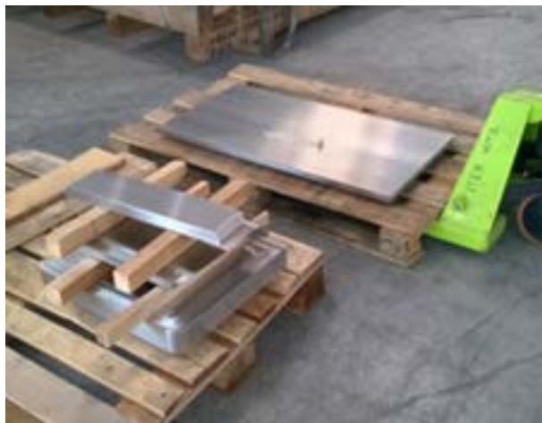
Figura 5: Piastre di chiusura della gamba curva.