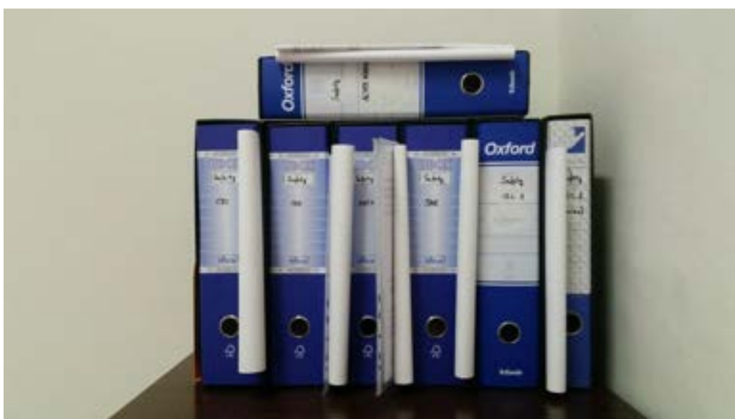
Figura 5. Faldoni all’interno dei quali sono state raccolte le norme tecniche.

Come anticipato in premessa, da una prima revisione del materiale normativo, si verifica che norme tecniche specifiche per i sistemi al sodio ad alta temperatura sono in corso di elaborazione a livello IEC. È possibile che a questa tipologia di sistemi di accumulo si possono anche applicare le norme che riguardano “Altri accumulatori”, cosa che è ancora in corso di verifica.