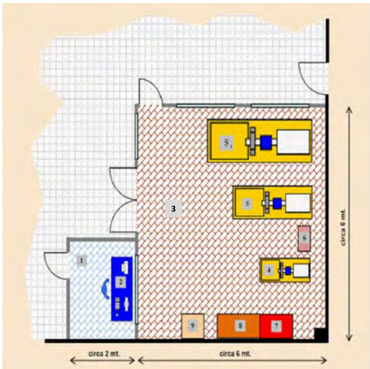
Figura 4: Layout del laboratorio

Nell'immagine su riportata si definisce: