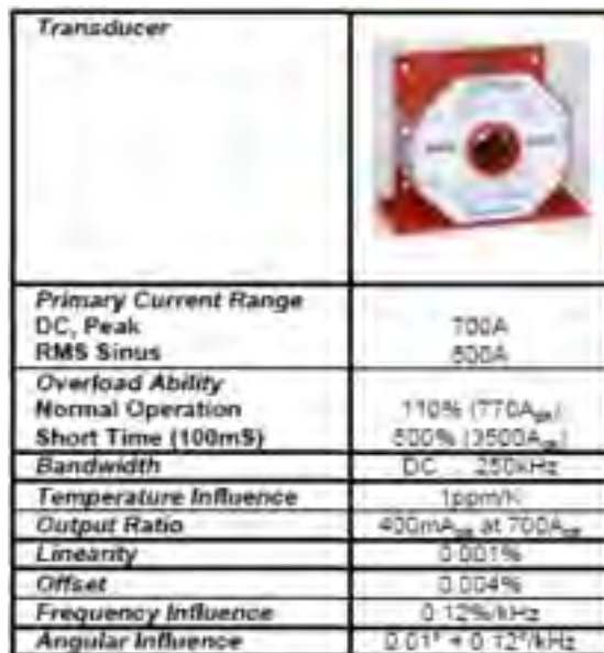
Figura 5: Caratteristiche TA

Per per il test di motori di grossa taglia per il rilievo delle correnti massime e di spunto, si è scelto di adottare n°3 TA di precisione da 500/700A di cui riportiamo le principali caratteristiche: