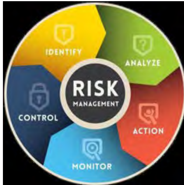
Figura 2: Schema riassuntivo sull'analisi del rischio

Per rendere la procedura standardizzata e per utilizzare un'applicazione identica in tutti i casi possibili, sono state elaborate delle schede per la valutazione di cui si riporta un esempio qui di seguito: