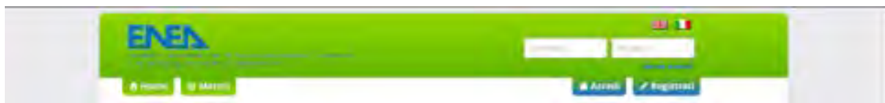
Figura 2: Form di inserimento delle credenziali di accesso.

Il sistema prevede cinque tipologie di utenti: