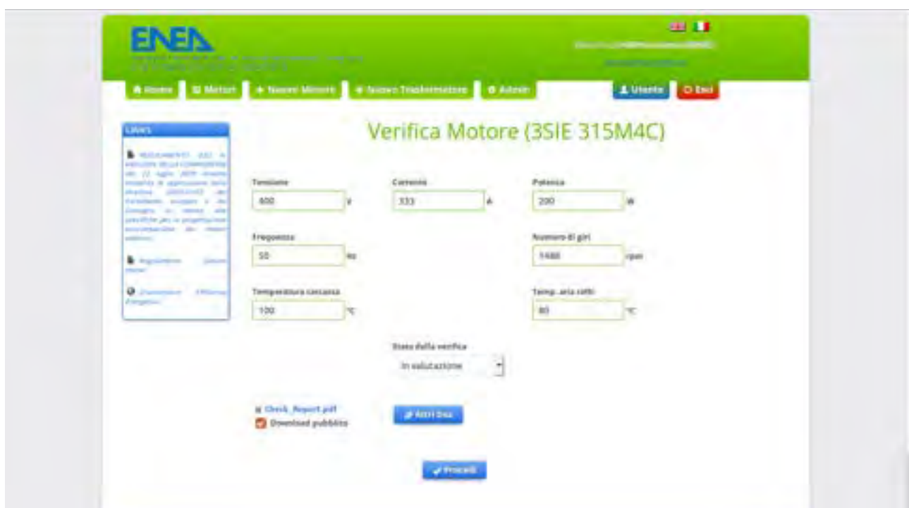
Figura 3: Form per l'inserimento dei dati di check.

In Figura 3 è illustrata la form realizzata nell'ambito delle attività oggetto del presente report al fine di permettere agli operatori di introdurre i dati relativi alle verifiche effettuate sui motori e gestire l'upload dei documenti connessi.