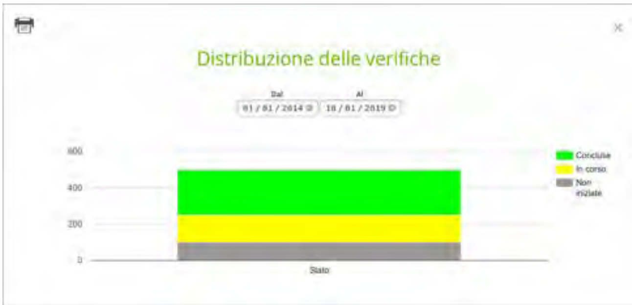
Figura 7: Informazioni statistiche sul processo di verifica relative ai motori presi in carico in un intervallo temporale desiderato

Tale modulo può essere efficacemente utilizzato per analizzare la produttività del processo di test o per schedulare i tempi di nuove verifiche.