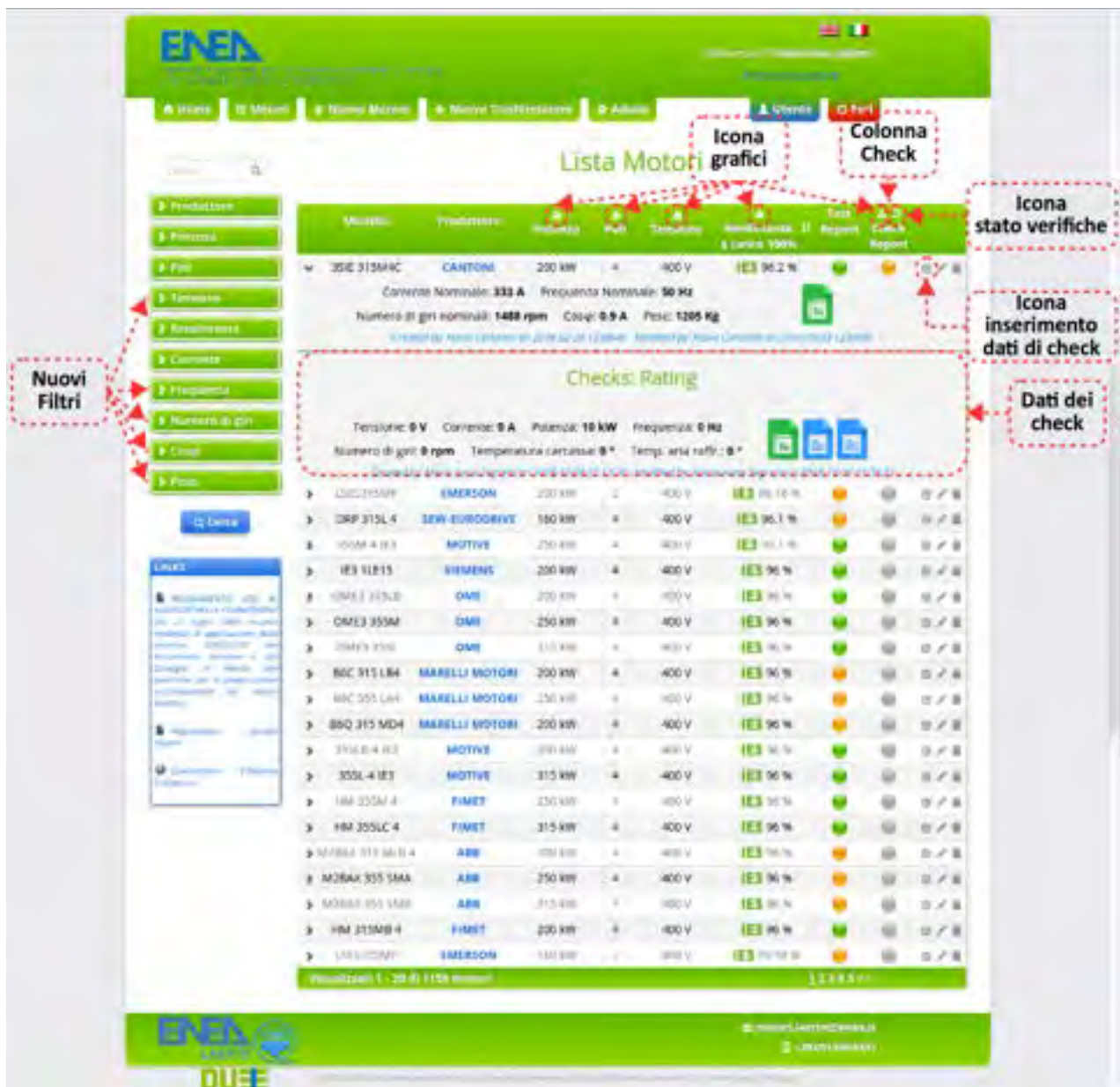
Figura 1: Portale Web ENEA.

Per una descrizione più estesa del Portale si rimanda al "Report RdS 003" redatto dalla stessa unità nell'ambito delle attività relative al PAR2017.