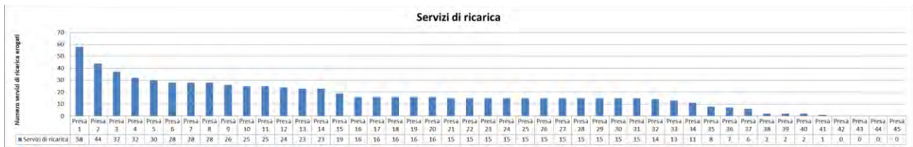
Figura 7: Numero di prese da attivare alla stazione 8 con ipotesi di tempo di attesa pari a 0 e livello di servizio pari a 100%

Questa soluzione appare non solo tecnicamente impraticabile, per via della potenza che sarebbe necessaria installare presso la stazione per servire contemporaneamente 25 autovetture elettriche, ma anche economicamente inefficiente in quanto, ad esempio, le prese da numero 16 a numero 25 servirebbero 1 solo utente la settimana, non rendendo sostenibile l'investimento di accensione di una nuova presa né di maggiore potenza installata.