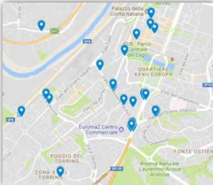
Figura 2: Localizzazione potenziali punti di ricarica

soggetto gestore/investitore. Le 32 potenziali localizzazioni sono elencate nella Tabella 1 e rappresentate nella Figura 2 di seguito riportata.