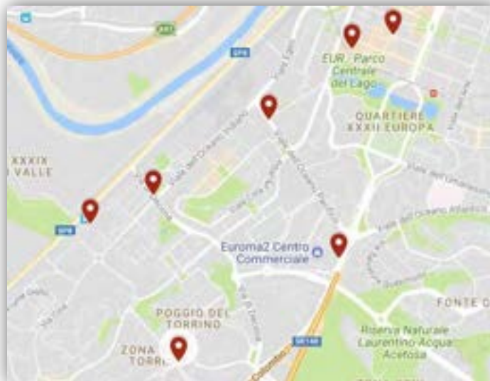
Figura 5: Mappa delle stazioni di servizio attivate

Essendo il criterio di risoluzione del problema ottimizzatorio basato sulla distanza, ne consegue che la scelta delle stazioni da attivare tra le 32 potenziali è dettato dalla prossimità delle stazioni ai punti di domanda. Una differente collocazione dei punti di sosta condurrebbe a conclusioni anche notevolmente differenti in termini di localizzazione dei punti di ricarica elettrica.