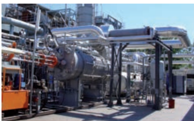
Reattore ISOTHERM-PWR di ITEA-SOFINTER

Obiettivi a breve termine sono la messa a punto di metodologie di progettazione che consentano di applicare i risultati ottenuti su di un impianto pilota al dimensionamento di impianti di potenza con taglie di interesse industriale (criteri di scalatura), e lo sviluppo di strumenti, numerici e sperimentali, per l'analisi e il controllo di processo. L'attività ha durata complessiva di tre anni e prende a riferimento il reattore ISOTHERM-PWR di ITEA-SOFINTER, reattore pressurizzato operante una combustione di slurry di acqua e carbone in ossigeno.