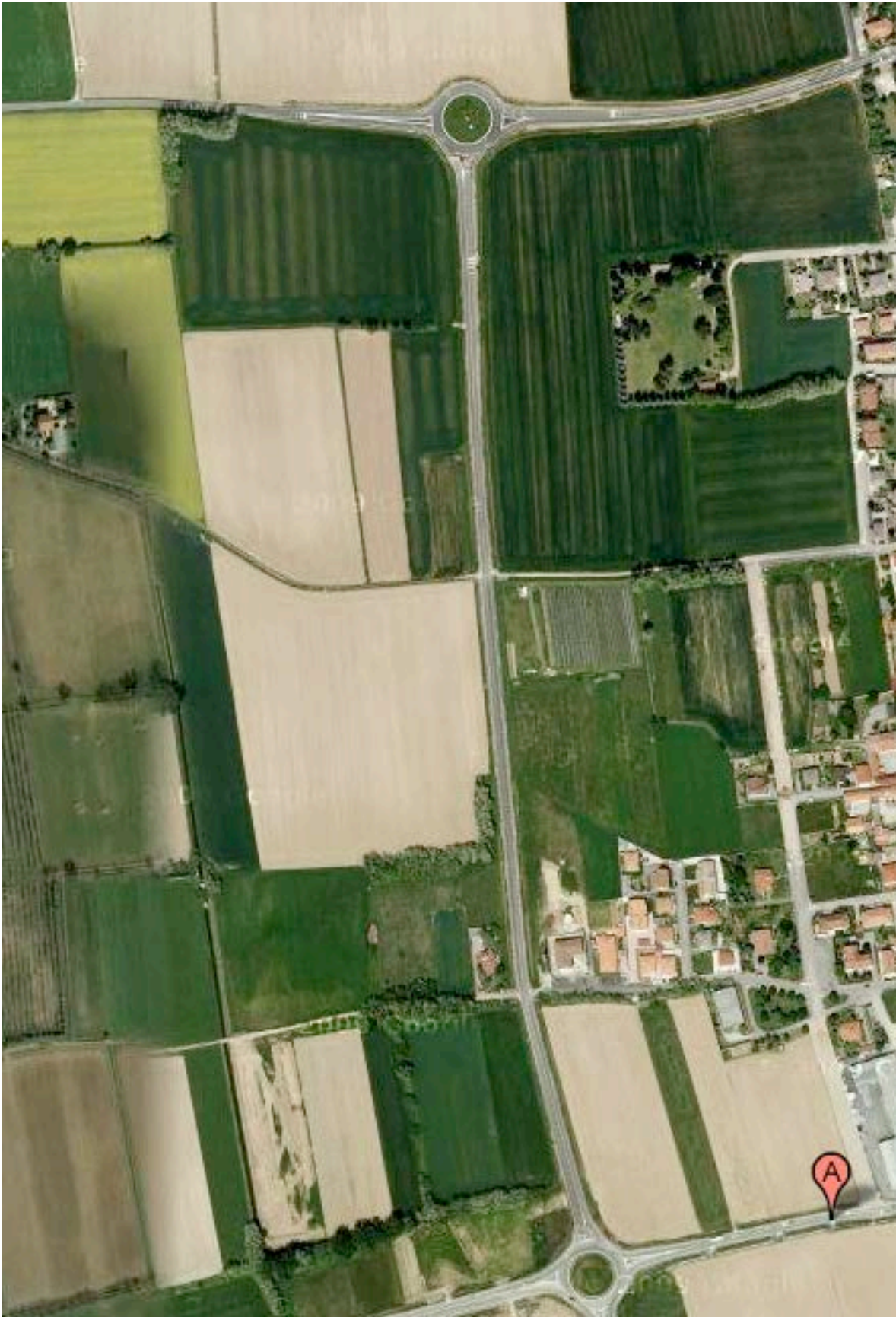
Figura 1 Sito oggetto delle prove (A: via Lega Lombarda) L'impianto prototipale sarà realizzato nella parte alta della strada, per non essere influenzati dalle case limitrofe.