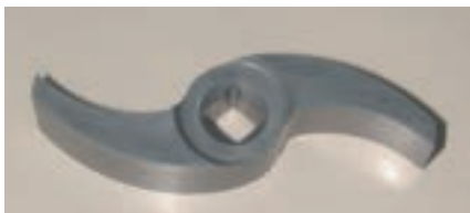
Girante, interamente realizzata in Ti_3SiC_2 , di pompa primaria di un LFR

corrosione/erosione combinati. L'attività è consistita nella progettazione e realizzazione di un prototipo di girante e nella ricerca e verifica sperimentale di un materiale costituente che presentasse elevata resistenza a corrosione/erosione. Il composto ternario Ti_3SiC_2 selezionato è stato testato attraverso una campagna sperimentale. Non si sono riscontrate né formazioni di ossidi superficiali né dissoluzione del materiale nel metallo liquido; il piombo non è penetrato attraverso le porosità aperte del Ti_3SiC_2 . È stata realizzata una girante interamente in Ti_3SiC_2 mediante lavorazione meccanica e elettroerosione, con ottimi risultati.