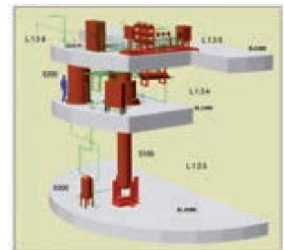
Vista isometrica dell'impianto CIRCE

Sulla base della specifica funzionale di prova è stato sviluppato il progetto della sezione di prova da installare nell'impianto CIRCE presso il Centro ENEA Brasimone. Il componente prototipico DHR, frutto della collaborazione tra ENEA, l'operatore industriale DEL FUNGO GIERA ENERGIA SPA ed il CIRTEN, è costituito essenzialmente da un fascio di tubi a baionetta immerso in un bagno di piombo fuso. Una soluzione come quella proposta, caratterizzata da una doppia parete metallica con intercapedine riempita in elio, interposta tra il primario e il secondario negli elementi di scambio termico dello scambiatore immerso, permette di ottenere una barriera costituita da due pareti meccanicamente indipendenti, ciascuna delle quali dimensionata per resistere da sola ai carichi imposti. Si ottiene nel contempo un mezzo di monitoraggio in continuo, durante il funzionamento, dell'integrità di ciascuna delle due pareti, grazie al riempimento dell'intercapedine in elio.