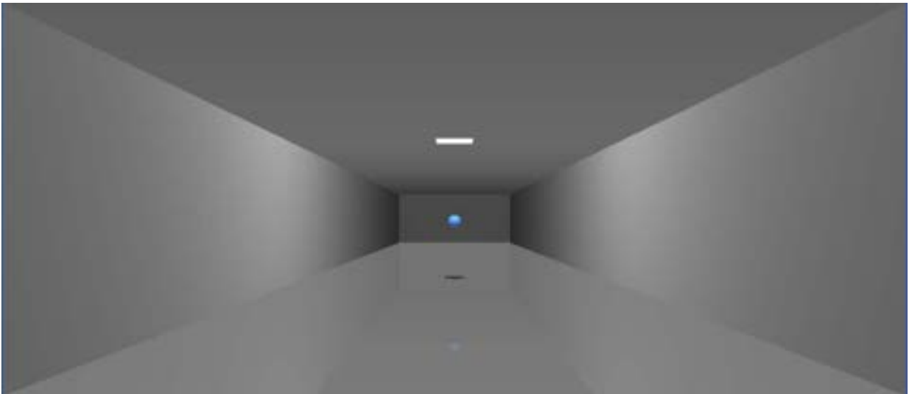
Figura 3: Setup sperimentale (non basato su dati illuminotecnici) per test preliminari sull'influenza di elementi di illuminazione nella percezione spaziale di ambienti virtuali.

La considerazione di scenari fotorealistici basati su dati illuminotecnici in Realtà Virtuale avrebbe un ruolo fondamentale in questo ambito di ricerca, in quanto permetterebbe di considerare alcuni approcci ancora non considerati nello stato dell'arte.