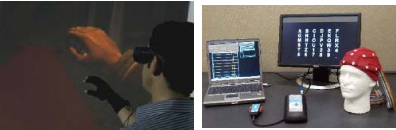
Figura 2: Data glove (a sinistra) e g.Mobilab+ (a destra), due dispositivi di interazione utilizzati nel Teatro Virtuale.

In Figura 2 sono presentate alcune immagini di questi dispositivi.