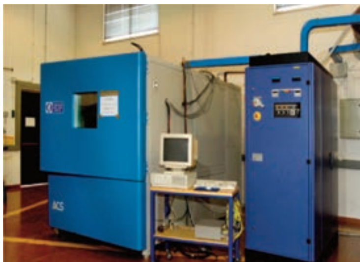
Attrezzatura per le prove del sistema di accumulo a batterie

e alla maggiore funzionalità e integrazione dell'impianto con la rete elettrica secondo le logiche di "smart grid".