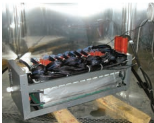
Il sistema di batterie usato come banco di prova per la messa a punto del prototipo finale

I vantaggi dell'intervento riguardano principalmente l'ottimizzare l'assorbimento di energia elettrica dalla rete di distribuzione nelle fasi di massimo impegno di corrente (es. partenza della vettura) e il recupero durante la fase di marcia in discesa, oltre ai benefici indotti in termini di miglioramento della "power quality"