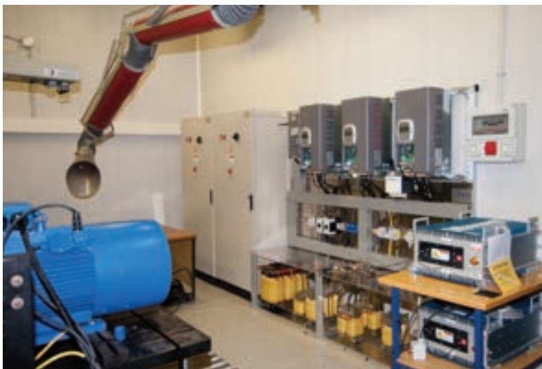
Vista del prototipo di impianto di sollevamento con recupero di energia tramite supercondensatori

Infine, è stato messo a punto un modello su piattaforma Matlab/Simulink di sistemi di accumulo a supercondensatori in applicazioni idonee a conseguire il "peak shaving" in utenze caratterizzate da assorbimenti impulsivi di potenza intervallati da periodi a basso prelievo o in applicazioni di "power quality".