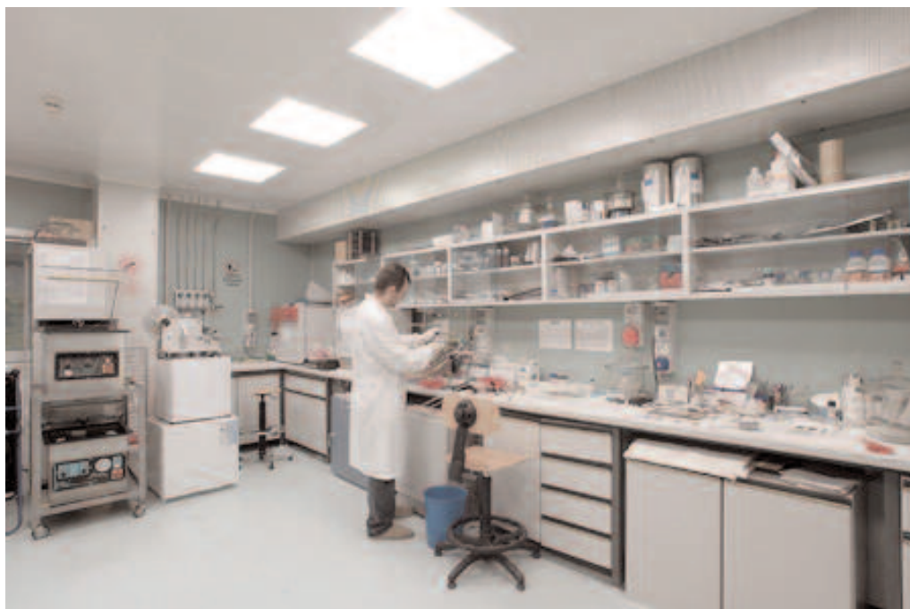
Laboratorio ENEA ad atmosfera controllata (camera secca) per la preparazione e la caratterizzazione di celle al litio