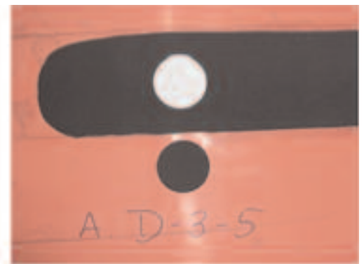
Preparazione di elettrodi anodici a forma circolare per realizzazioni di celle nei laboratori ENEA

L'attività ha previsto la ricerca di materiali catodici per celle al litio particolarmente adatti per le applicazioni nelle reti elettriche. I materiali sono stati scelti per rispondere ad esigenze di alte prestazioni (potenza ed energia), basso costo e basso impatto ambientale. L'attenzione si è concentrata su materiali catodici del tipo \text{LiFePO}_4 , opportunamente drogato con diversi composti, che hanno consentito di ottenere prestazioni molto promettenti in termini di capacità specifica e di efficienza durante i cicli di carica e scarica a vari regimi. La composizione dei catodi è stata ottimizzata e resa di-