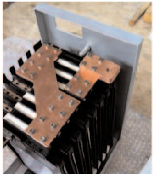
Porzione di batteria al litio per la funicolare di Bergamo

Sono state analizzate le caratteristiche di alcune potenziali utenze con una valutazione delle necessità della rete e dell'utenza e con lo studio dell'interfaccia e delle logiche di gestione e controllo dei diversi componenti/sottosistemi di rete, nell'ottica di transizione verso una struttura di rete efficiente, flessibile, dinamica ed interattiva.