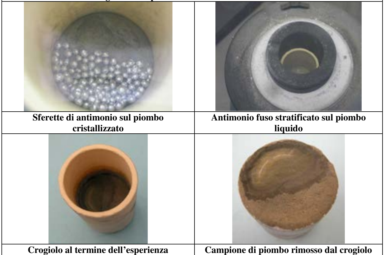
Figura 9 – Esperienza con ossido di cerio in granuli