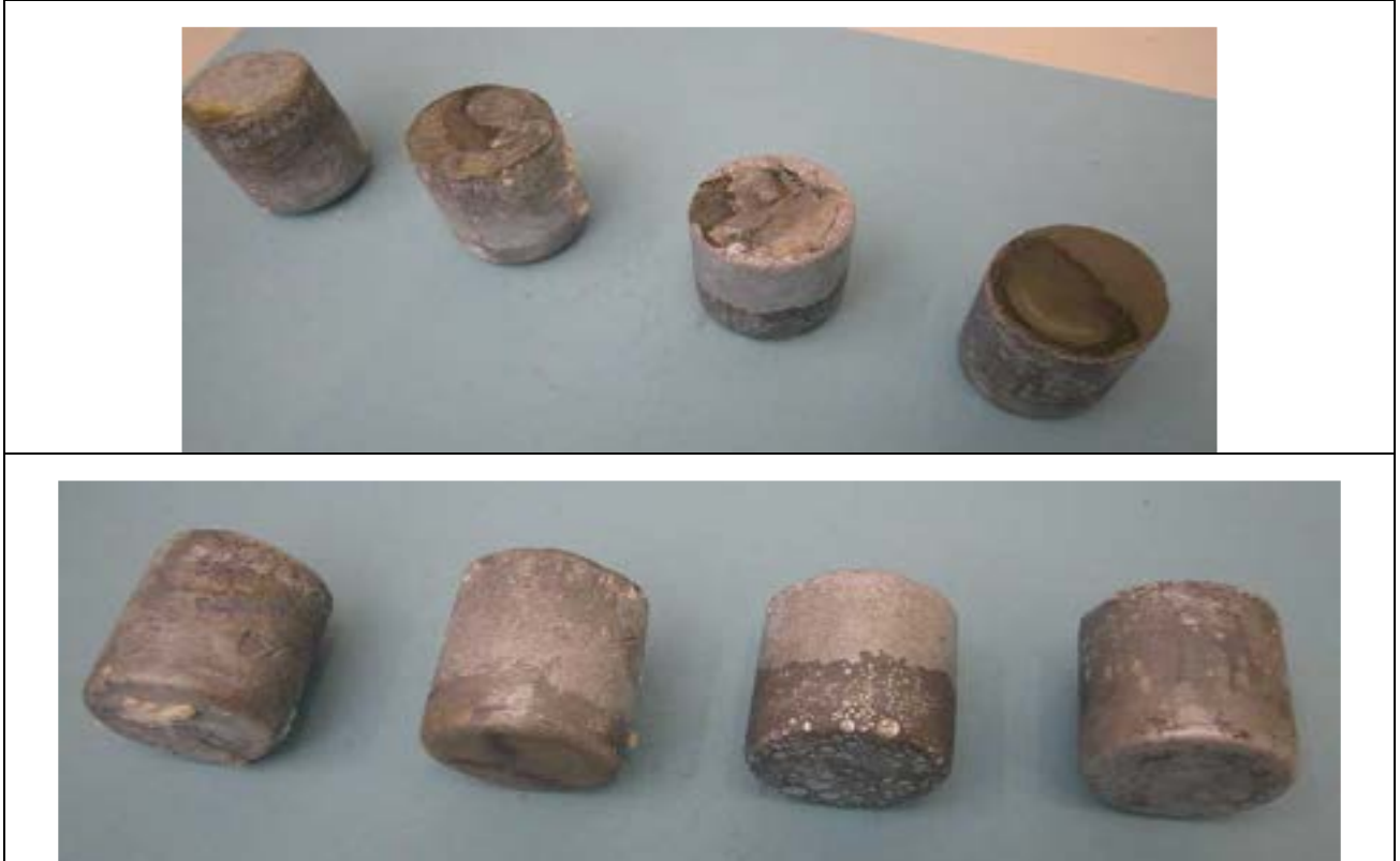
Figura 5 – Campioni di piombo fuso al termine delle esperienze