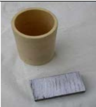
Panetto di Pb e crogiolino in allumina