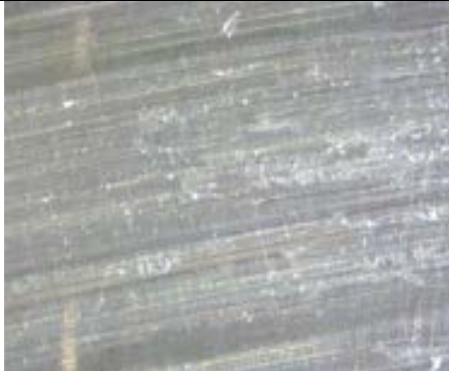
Superficie di Pb cristallizzato