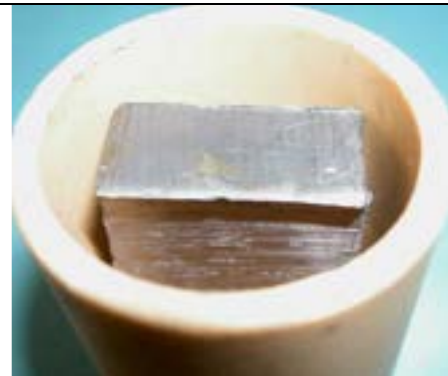
Panetto di Pb all'interno del crogiolo