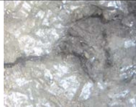
Superficie di Pb cristallizzato