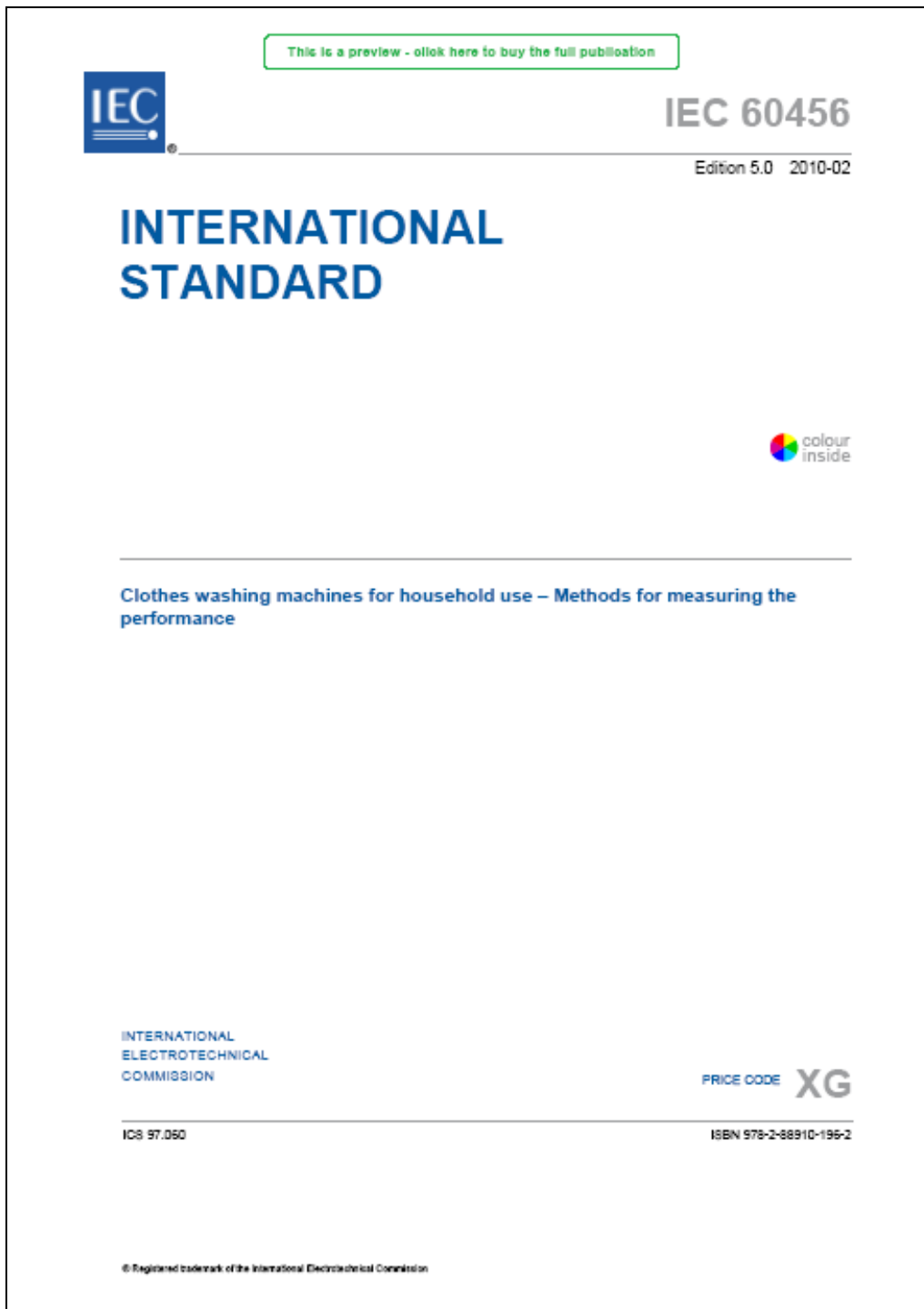
Figura 1: Copertina dello standard IEC 60456 Ed. 5: 2010