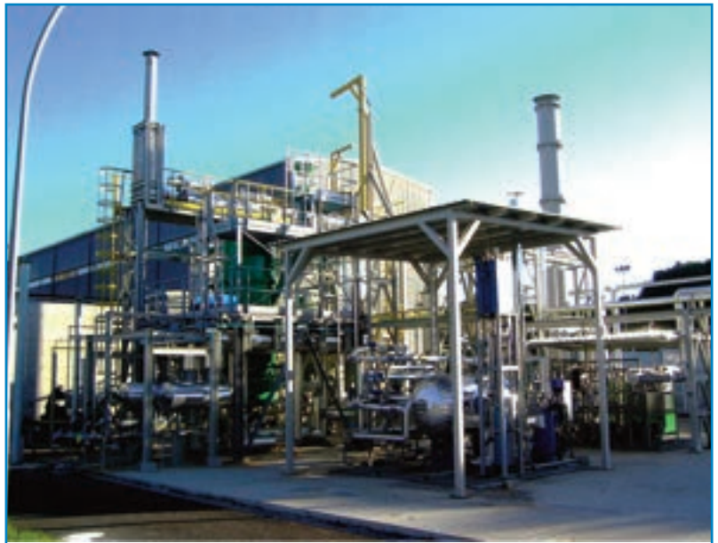
Infrastruttura di ricerca ZECOMIX (Zero Emission of CarbOn with Mixed Technology)

differenti soluzioni tecnologiche per la produzione di coal water slurry e individuazione delle BAT.