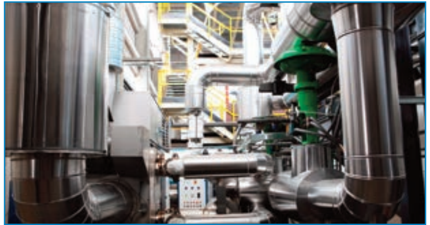
Piattaforma sperimentale AGATUR