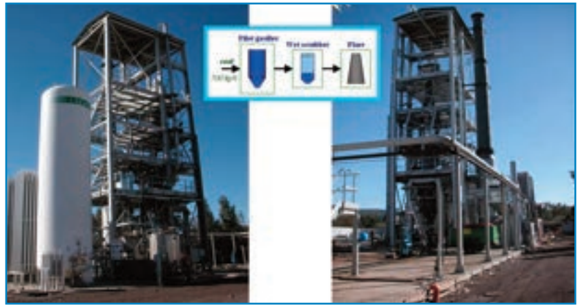
Impianto dimostrativo di gassificazione Sotacarbo da 5 MWt

ENEA), per sviluppo e sperimentazione di gassificazione e co-gassificazione di carboni e biomasse, nonché per sperimentazione di catalizzatori e configurazioni multi-reattore per la produzione, a partire da miscele costituite da syngas e idrogeno, di gas naturale sintetico (SNG) ad elevata concentrazione di metano. Sviluppo di modellistica per l'analisi tecnica ed economica del processo di produzione di SNG integrato con sistemi CCUS. Sviluppo, caratterizzazione e prova di nuovi catalizzatori.