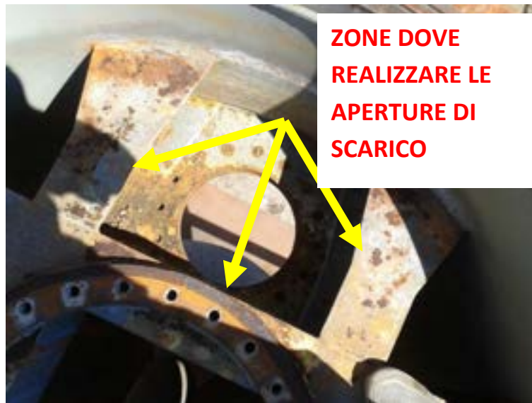
Fig. 2.4 – Vista di dettaglio della struttura di sostegno della griglia e del pignone

Si allegano di seguito alcune immagini dei componenti smontati in officina.