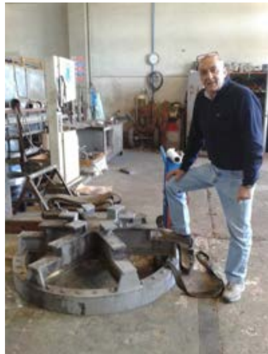
Fig. 2.3 - Viste di insieme del cono di scarico ceneri e basamento griglia mobile

Tali problematiche sono state analizzate con i tecnici dell'ENEA che hanno progettato con i tecnici SOTACARBO, le seguenti modifiche: