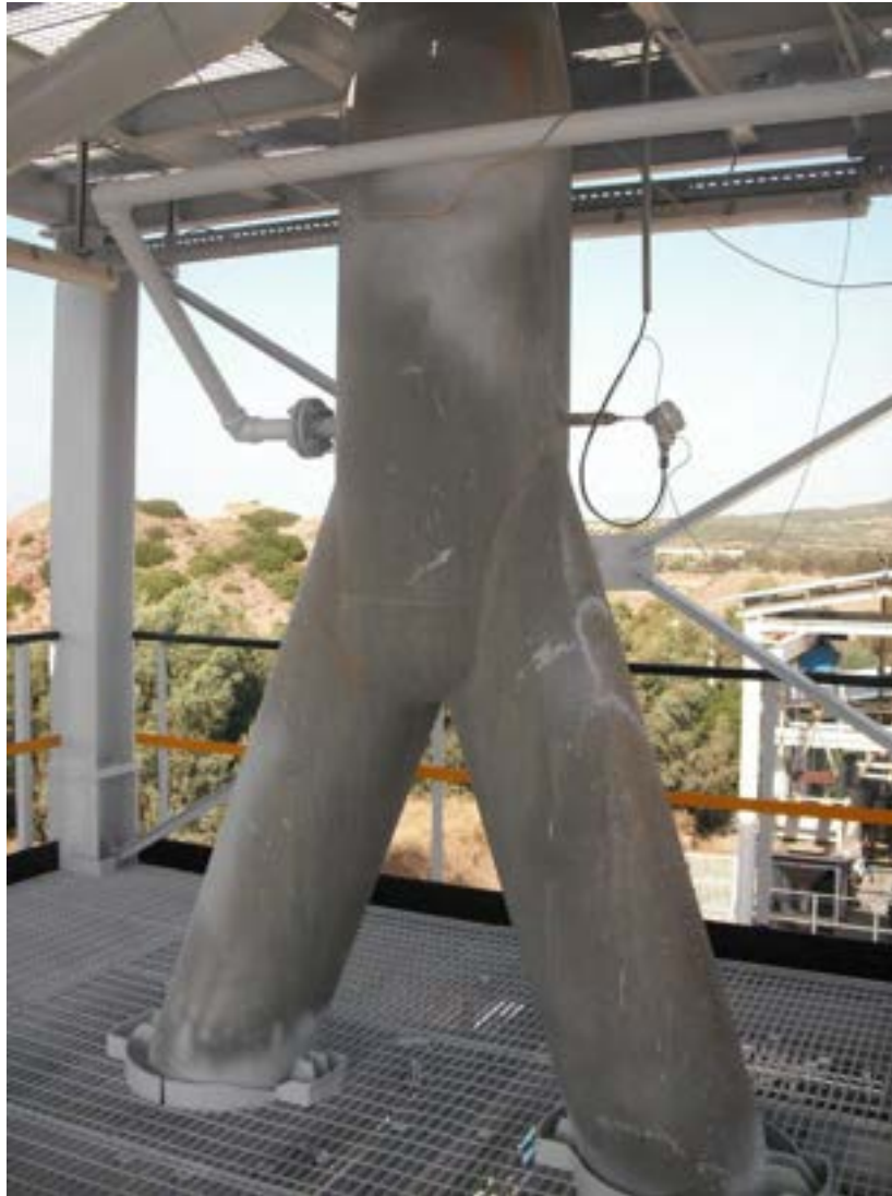
Figura 2.2 Tubazioni del sistema a Y per il caricamento del combustibile nel gassificatore.

In tale sistema sono stati revisionati i misuratori di livello e le ghigliottine di caricamento a cui sono stati sostituiti i distributori di aria strumenti inoltre sono state lubrificate ed ingrassate. Il paranco è stato revisionato; poiché a causa degli agenti atmosferici e del non utilizzo inizialmente non funzionava. Prima del test sperimentale a caldo è stato effettuato un test a freddo sul sistema al fine di verificare il funzionamento del sistema. Esso ha avuto esito positivo.