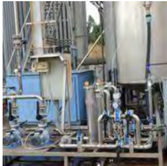
Figura 2.9 vasca di accumulo e sistema di ricircolo acqua di lavaggio.

Sullo scrubber sono state eseguite le seguenti attività: