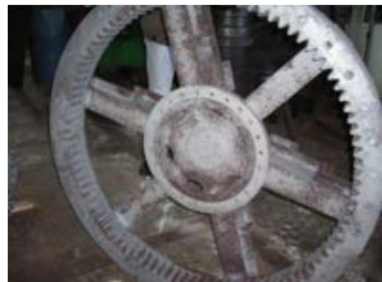
Fig. 2.5 – Vista di dettaglio del pignone e della corona