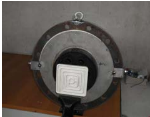
Figura 2.6 IRRADIATORE.

Riportiamo di seguito un'immagine di un irradiatore con la sua lampada e della sezione del gassificatore dove sono posizionati gli irradiatori: