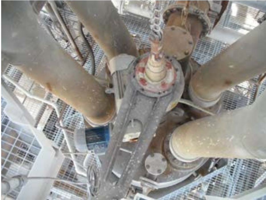
Figura 2.8 STIRRER.

mescolamento del letto, pistone oleodinamico dotato di centralina che permette al pistone di salire e scendere, motore di rotazione con una cella di carico per stimare la sua resistenza alla rotazione, un sistema di circolazione di acqua interna allo stirrer per il suo raffreddamento. Lo STIRRER ha la forma di una T rovesciata di seguito riportiamo la figura in cui si notano i motori di rotazione e traslazione insieme al sistema con la corda di acciaio che collega lo stirrer al pistone oleodinamico.