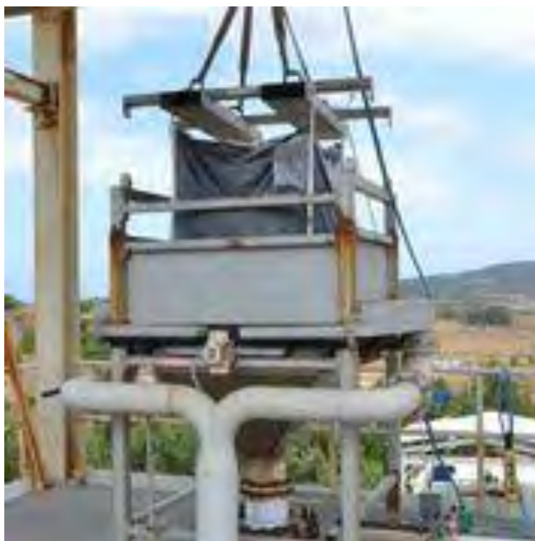
Figura 2.1 Tramoggia del sistema di caricamento del gassificatore.

Il sistema è composto: da un paranco per il sollevamento del combustibile, una tramoggia per contenere il combustibile da inviare nel gassificatore, tre valvole a ghigliottina per effettuare il caricamento del combustibile. Il combustibile viene trasportato in tramoggia tramite dei big-bag; essi sono dei contenitori dotati di bretelle per fissare il sacco al paranco e di un sistema di apertura dal basso del sacco. Il big-bag viene posizionato sulla tramoggia di caricamento da cui viene svuotato il combustibile presente all'interno; successivamente è presente una prima ghigliottina tramite la quale il materiale viene immesso in un sistema a forma di Y del volume di 1,1 \text{ m}^3 (un big-bag ha volume 1 \text{ m}^3 ) con due valvole a ghigliottine che consentono l'ingresso del combustibile nel gassificatore, il riempimento di tale sistema viene monitorato con dei misuratori di livello. Riportiamo di seguito due immagini del sistema: