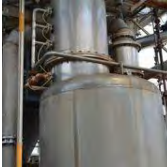
Figura 2.8 Scrubber.