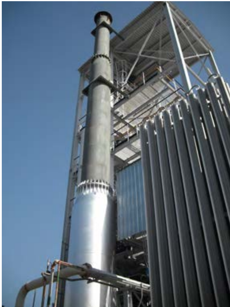
Figura 2.10 Torcia.

La torcia dell'impianto Dimostrativo ha il compito di bruciare il syngas prodotto dal gassificatore. Essa è composta: da un sistema di adduzione GPL, sistema di accensione con fiamma Pilota, camera di combustione, cammino di evacuazione fumi, ventilatore aria comburente. La torcia funziona in maniera completamente automatica gestita tramite un PLC indipendente dal sistema di regolazione e controllo, L'operatore da sala controllo deve unicamente dare il comando di start per l'accensione e stop per lo spegnimento. L'operatore ha comunque possibilità di monitorare il funzionamento della torcia grazie all'acquisizione dati che avviene dal PLC del quadro torcia al sistema di regolazione e controllo. La torcia non ha funzionato nei primi test funzionali a causa di una problematica al suo PLC per questa motivazione è stato necessario far intervenire il tecnico della ditta fornitrice e ripristinare le funzionalità del PLC; inoltre è stata prevista la sostituzione del PLC in quanto ha mostrato delle problematiche permanenti. Riportiamo di seguito un'immagine della Torcia.