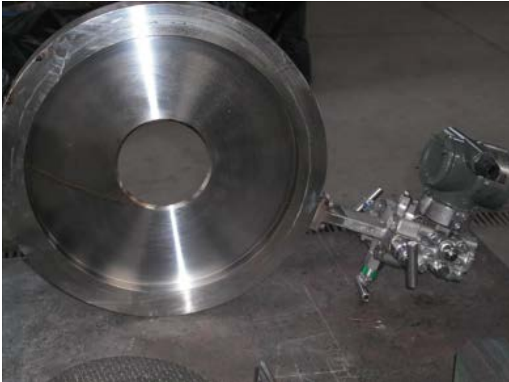
Figura 2.12. Misuratore di portata syngas.

Lo strumento è stato interfacciato al sistema di controllo utilizzando sul quadro PLC Dimostrativo un canale di ingresso di tipo analogico 4-20 mA con alimentazione 24V interna ed stato denominato FT001P. Riportiamo un'immagine dello strumento descritto