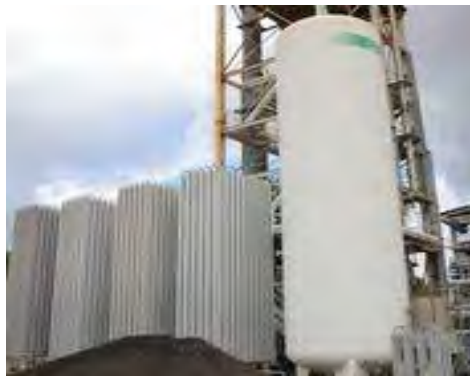
Figura 2.11. Sistema di stoccaggio e adduzione azoto liquido.

Sulla base dei dati di progetto l'impianto dovrà erogare 2000 m 3 /h alla pressione di 0.5 bar tale portata si è resa necessaria per poter inertizzare l'intero l'impianto in circa 5 minuti in caso di spegnimento rapido. Riportiamo di seguito un'immagine dell'impianto descritto: