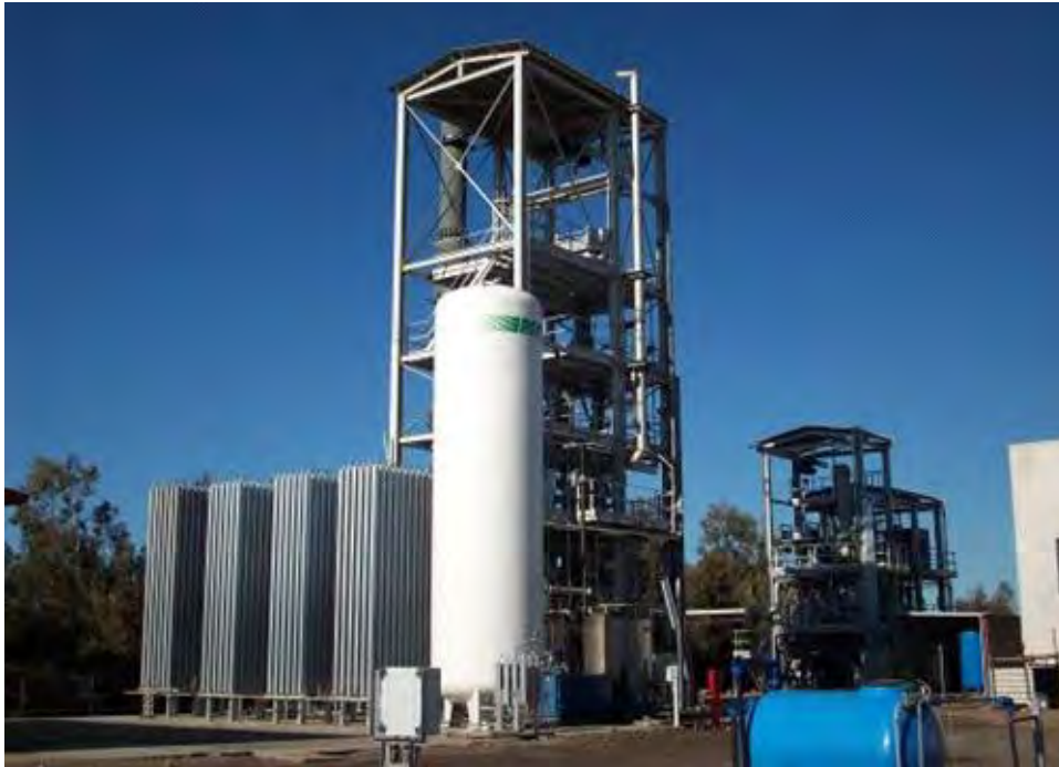
Figura 1.1 - La piattaforma pilota Sotacarbo

Nell'ambito delle attività di ricerca per lo sviluppo di un processo di cogassificazione di carbone e biomasse a emissioni estremamente ridotte di agenti inquinanti, Sotacarbo ha sviluppato una Piattaforma Sperimentale (Figura 1) comprendente due impianti di gassificazione in letto fisso up-draft e una linea per la depurazione e lo sfruttamento energetico del syngas.