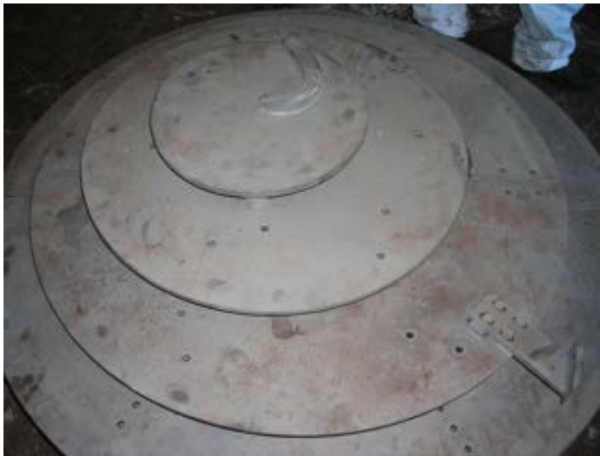
Figura 1.2. La parte esterna della griglia del gassificatore Dimostrativo.

Il letto di combustibile poggia sopra una griglia metallica che fino a questo momento non ha funzionato a causa di problematiche che verranno descritte più avanti. La griglia consente lo scarico delle ceneri attraverso un sistema composto da più piani concentrici come mostrato nella figura 1.2 .