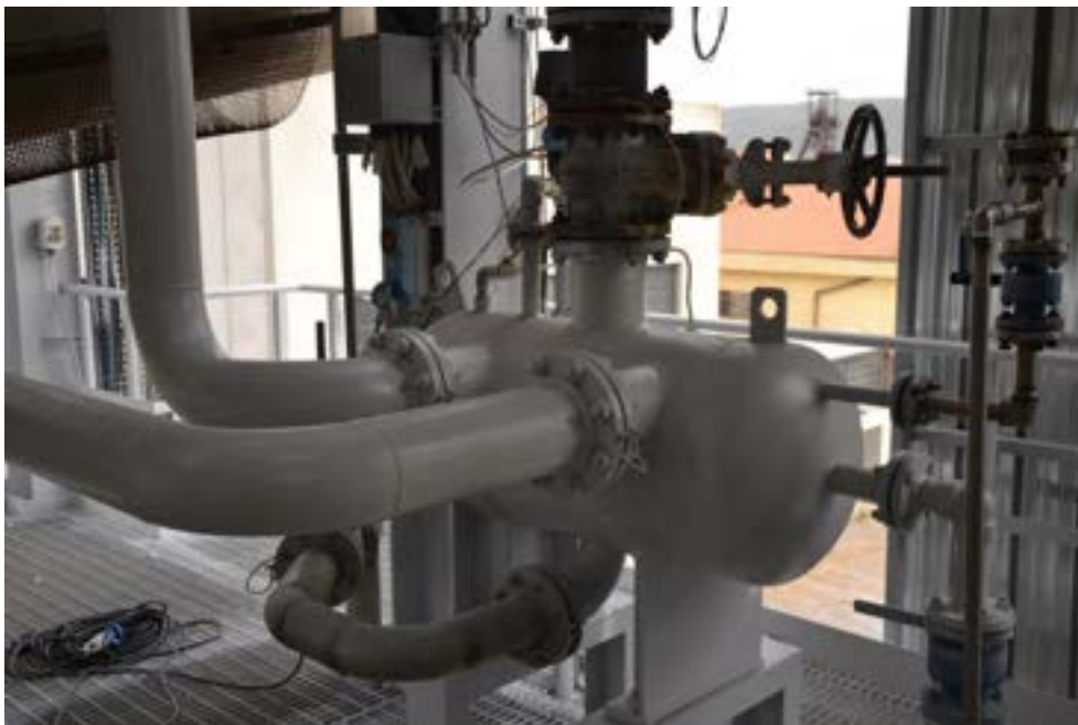
Figura 2.6 Steam Drum.