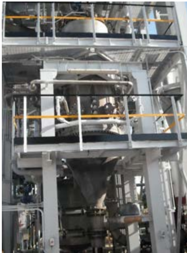
Figura 1.1. La parte inferiore del gassificatore Dimostrativo.

Il profilo termico all'interno del gassificatore è determinato mediante 36 termocoppie posizionate sulle pareti del gassificatore su sei livelli differenti. Su ogni livello sono presenti sei termocoppie a 60° l'una dall'altra. Riportiamo di seguito un'immagine del gassificatore e una tabella della disposizione delle termocoppie rispetto all'altezza del gassificatore.