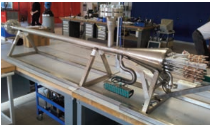
Fuel Pin Bundle Simulator, Impianto NACIE

Infine si sono implementate infrastrutture di ricerca di enorme rilevanza (HELENA), e aggiornate le infrastrutture esistenti (CIRCE, NACIE), con lo scopo sia di caratterizzare lo scambio termico nel nocciolo, sia di caratterizzare sperimentalmente i sistemi di trasporto termico (DHR, SG).