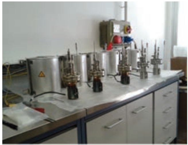
Vista del laboratorio di chimica del piombo presso il CR ENEA Brasimone