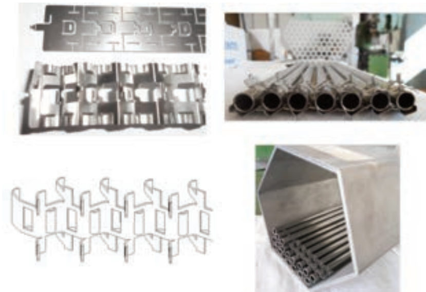
Vista griglia spaziatrice del DEMO-LFR ALFRED (FN SPA)