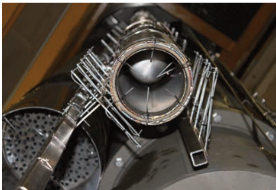
Vista sezione di prova impianto CIRCE

Area di ricerca: Produzione di energia elettrica e protezione dell'ambiente