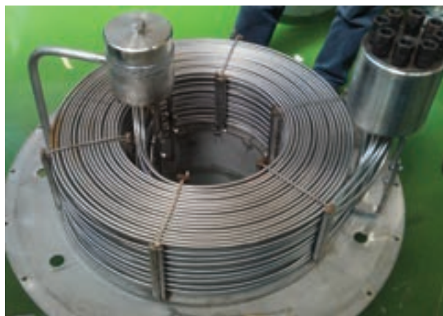
Vista del Generatore di Vapore (GV) a spirale piana per applicazione in sistemi a piombo