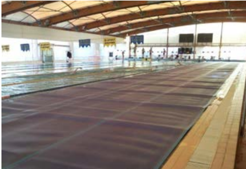
Fig.4.5 – Piscina 50, parzialmente coperta, in esercizio parziale

Per massimizzare il risparmio andrebbe presa in considerazione, data la ridottissima evaporazione, anche la possibilità di ridurre al minimo la ventilazione notturna risparmiando anche sui consumi elettrici della UTA.