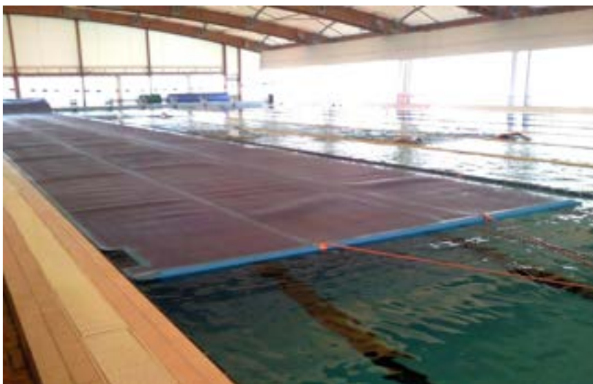
Fig.4.3 – Piscina 50, Giulio Onesti, in fase di copertura con i teli isotermici

Le misurazioni del periodo estivo sono state effettuate per due mesi; un mese coprendo la piscina 50 con i teli nelle 11 ore notturne ed un mese lasciandola scoperta.