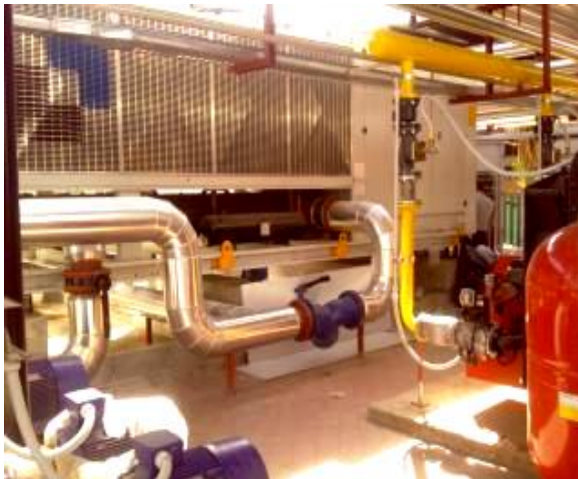
Fig.4.2 – Scambiatore, collegato alla pompa di calore reversibile, per il recupero del calore derivante dal raffrescamento estivo

Sulla base dei prezzi applicati al CONI Servizi per l'energia elettrica ed il gas metano, il costo finale del kWh termico è risultato pari a 0,0614 €/kWh +iva se generato dal PDC e pari a 0,0764 €/kWh +iva se generato dalla caldaia a gas. In questo caso si è rilevato un risparmio di circa 20.000 € rispetto all'anno precedente.