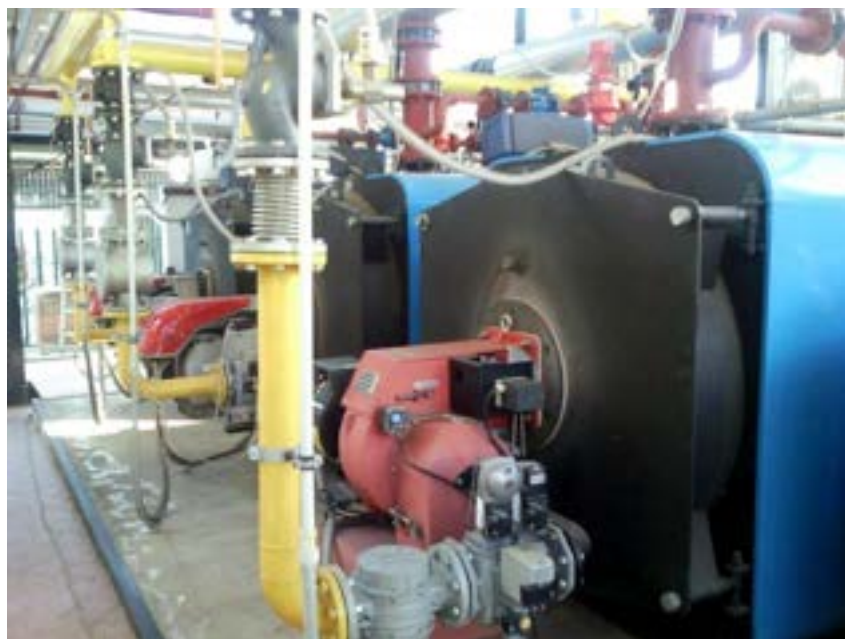
Fig.4.1 – Le tre caldaie in batteria, dotate di bruciatori modulanti, della nuova centrale termica

Nel funzionamento estivo, le PDC producono l'acqua refrigerata per il raffrescamento e, contemporaneamente, con un sufficiente recupero di calore (desurriscaldamento e condensazione) riscaldano l'acqua della piscine e l'ACS. La caldaia interviene solo in caso di scarsa disponibilità di ACS o di riempimento completo della piscina.