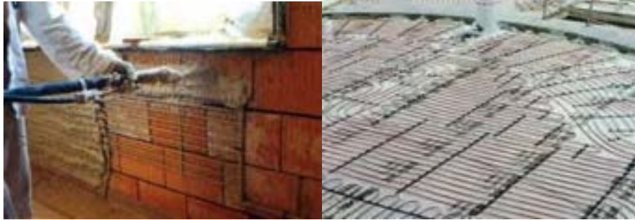
Pannelli radianti a parete e a pavimento

Come già detto per i convettori a battiscopa, è inutile mettere un pannello radiante dietro un armadio.