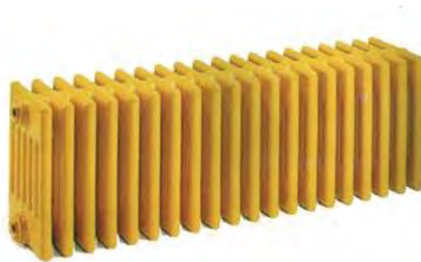
Radiatore tradizionale a elementi e colonne

Così disposti, i vari elementi si scambiano a vicenda calore per irraggiamento, scaldando l'aria che li circonda ed innescando un moto convettivo; solo una piccola parte del calore viene trasmessa per irraggiamento dalla superficie rivolta verso l'ambiente.