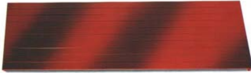
Piastra radiante disposta in orizzontale

Recentemente sono entrati in commercio i convettori a battiscopa, essi sono formati da uno o due tubi (in genere di rame) nei quali circola acqua calda, circondati da una fitta serie di alette; il tutto, racchiuso in un profilo di alluminio, ha uno spessore di circa 3 cm. Vengono installati lungo le pareti esterne al posto del battiscopa, possono anche essere incassati riducendo la loro sporgenza.