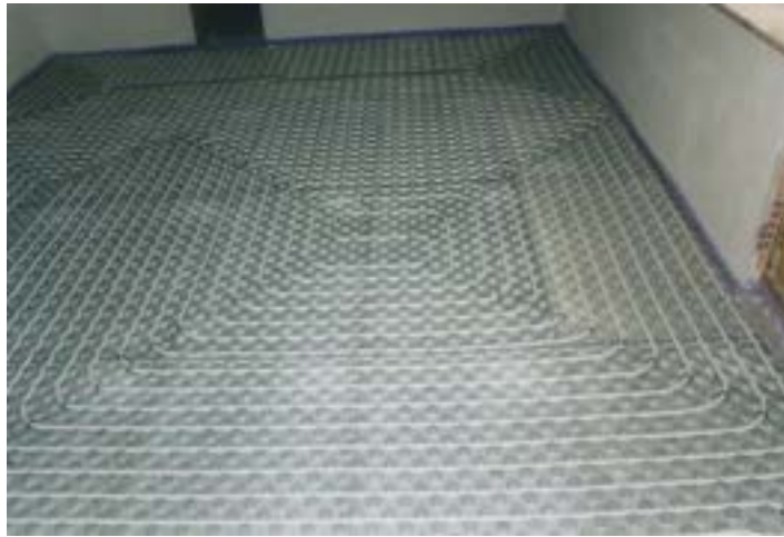
Figura S1. Pavimento scaldante alimentato da collettori solari