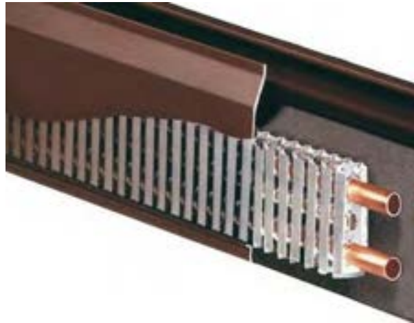
Spaccato di un convettore a battiscopa

Un altro sistema è quello a pannelli radianti. Si tratta di serpentine in rame o materiale plastico nelle quali circola acqua ad una temperatura tra i 30 - 45°C, esse sono incorporate nello strato di intonaco che riveste pareti e soffitti o nel sottofondo dei pavimenti. Il trasferimento di calore è per irraggiamento, le superfici riscaldate dalle serpentine irradiano persone e cose e scaldano molto meno l'aria. Si ottiene così un comfort termico migliore con pareti calde (25 - 30°C) e aria più fresca (16 - 18°C circa). Questi sistemi non coinvolgendo l'aria non sollevano polvere e soprattutto non la "abbrustoliscono". Facendo circolare acqua a bassa temperatura disperdono molto meno calore verso esterno, inoltre avendo bassa inerzia termica scaldano l'ambiente in breve tempo permettendo di accendere l'impianto poco tempo prima. Sono particolarmente vantaggiosi quando si devono riscaldare ambienti con grande volume, e consentono l'alimentazione con pannelli solari.