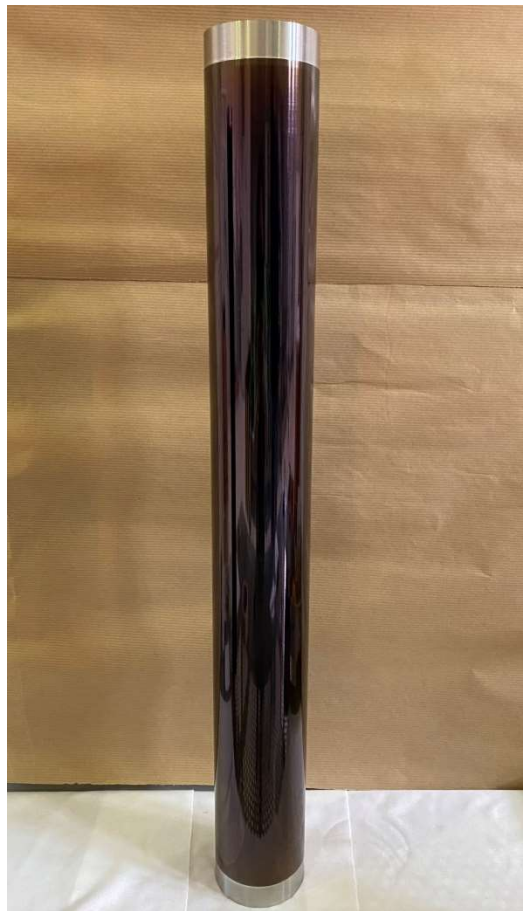
Figura 2. Immagine del prototipo di coating realizzato per operare in aria alla temperatura di 500 °C, depositato su tubo di acciaio