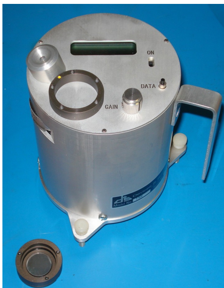
Figura 1: riflettometro D&S 15R-USB

La frequenza della ripetizione delle misure in campo è stata determinata dai giorni effettivi di presenza del personale addetto sull'impianto (restrizioni anti-covid sui posti di lavoro), nonché dalle condizioni meteo. Più precisamente si sono effettuate le misure ogni qualvolta se ne aveva l'opportunità e la superficie riflettente era asciutta.