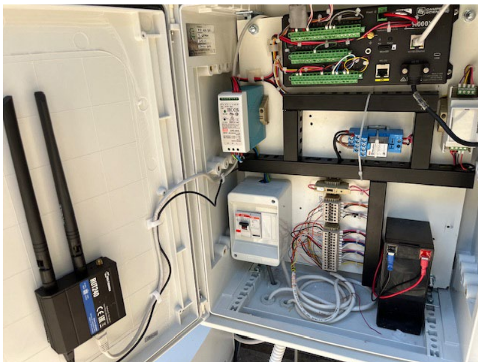
Figura 1 - Sistema di acquisizione dati e controllo

Il datalogger contenuto nel sistema, è configurato e programmato con diverse strategie e algoritmi (accensione manuale, accensione temporizzata, accensione con soglie legate all'indice di calore): esso inoltre controlla attraverso le sue interfacce hardware tutti i sensori necessari, l'accensione del sistema di nebulizzazione dell'acqua, la memorizzazione dei dati raccolti e infine attraverso il sistema di trasmissione su rete cellulare, l'invio dei dati sulla piattaforma web predisposta. Figura 1 riporta una vista dell'armadietto contenente il datalogger, la batteria di sicurezza, l'interruttore elettrico e il sistema per invio dei dati.