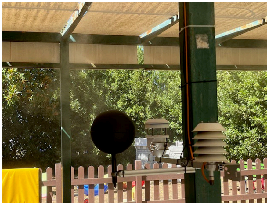
Figura 2 - Postazione sensori aria mitigata

I parametri ambientali rilevati che hanno alimentato l'algoritmo di controllo, e gli indici di comfort termico per l'area mitigata e per l'area esterna, sono stati: velocità e direzione del vento; temperatura e umidità relativa dell'aria; temperatura media radiante.