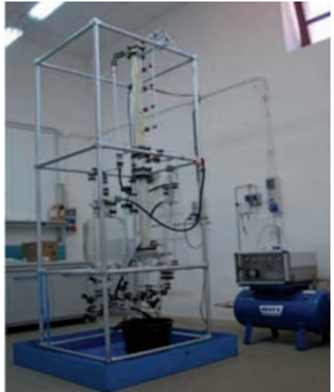
Impianto prova solventi liquidi (Sotacarbo)

Sono state acquisite competenze in merito alla cattura della CO 2 da syngas con ammine. È stata effettuata una comparazione prestazionale tra ammine primarie, secondarie, terziarie e/o miscele, valutando l'influenza dei principali parametri di processo sull'efficienza di cattura. È stato analizzato il processo di rigenerazione termica dei solventi. In parallelo è stata sviluppata una modellistica specifica relativa all'impiego di diversi solventi. La finalità è quella di sviluppare modelli di supporto alle attività sperimentali.