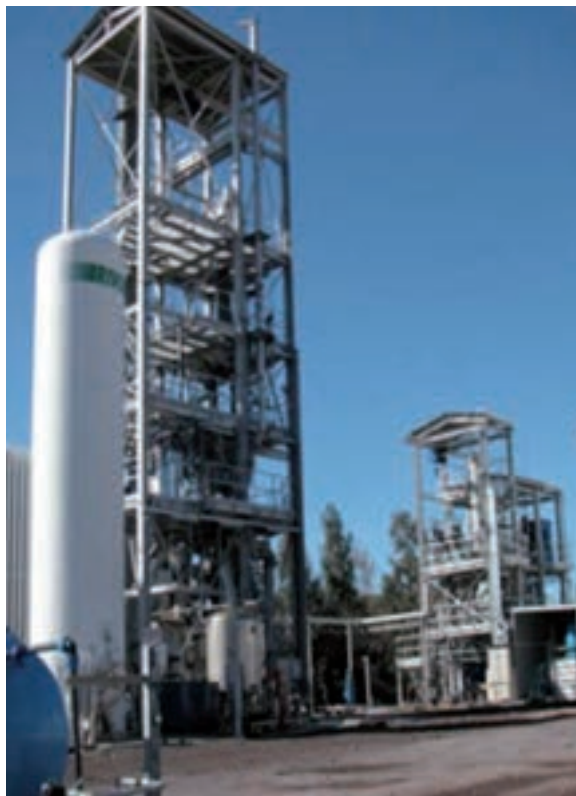
Piattaforma Pilota Sotacarbo

È stata definita la configurazione impiantistica, la taglia e la tecnologia più idonea per la realizzazione di un impianto per produzione di combustibili liquidi anche da carboni di basso rango (elevato contenuto di zolfo e tar). L'ana-