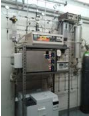
Impianto Ctl (Politecnico Milano)

Tropsch (sono stati selezionati i catalizzatori e determinati i parametri ottimi di funzionamento). È stato anche condotto uno studio di fattibilità tecnico-economica relativa ad un impianto di taglia industriale.