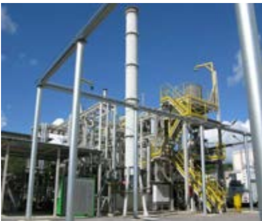
Piattaforma sperimentale ZECOMIX

Le tecnologie pre-combustione operano la “decarbonizzazione” del combustibile fossile a monte della combustione rilasciando un syngas ad alto contenuto di idrogeno utilizzabile come combustibile in impianti di produzione elettrica. Sono stati sviluppati sorbenti solidi ad alta temperatura, a base di CaO, altamente performanti, per la cattura della CO 2 . È stato realizzato il primo esercizio di un Dimostrativo del ciclo ZECOMIX (Zero Emission Coal MIXed technology) che integra gassificazione, pulizia syngas e cattura della CO 2 con sorbenti e combustione di idrogeno per la produzione di energia elettrica.