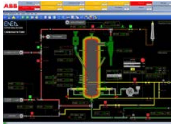
Sistema di controllo della piattaforma ZECOMIX: sinottico del Carbonatore