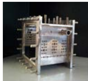
Bruciatore Trapped Vortex ENEA

Lo sfruttamento energetico, in turbine a gas, del syngas prodotto in processi di “decarbonizzazione pre-combustion” impone lo sviluppo di bruciatori innovativi. A tal fine è stato progettato e realizzato un bruciatore avanzato per turbine a gas, in grado di operare con syngas molto ricchi di idrogeno provenienti da processi di cattura pre-combustion, ed è stata realizzata una facility sperimentale per la sua validazione.