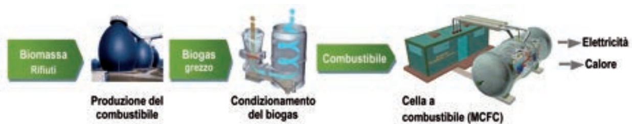
Schema generale del sistema a biomasse

qualità (elevata percentuale di metano o di miscele metano/idrogeno) e basso contenuto di impurezze;