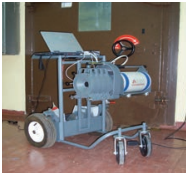
Strumento portatile per misura gamma

Nella prima annualità sono stati individuati i requisiti minimi del sito e analizzate le azioni propedeutiche alla progettazione del deposito, del quale sono stati individuati, in via preliminare, i criteri di progetto derivati dai requisiti di sicurezza stabiliti dalla IAEA. Sono stati anche identificati gli studi da effettuare (parzialmente già effettuati in passato) relativi a scenari, analisi territoriali, performance assessment, sicurezza dell'installazione, quadro normativo e di radioprotezione, migrazione dei nuclidi, livelli di sicurezza da garantire nel medio e lungo termine, implicazioni territoriali ed ambientali ecc.