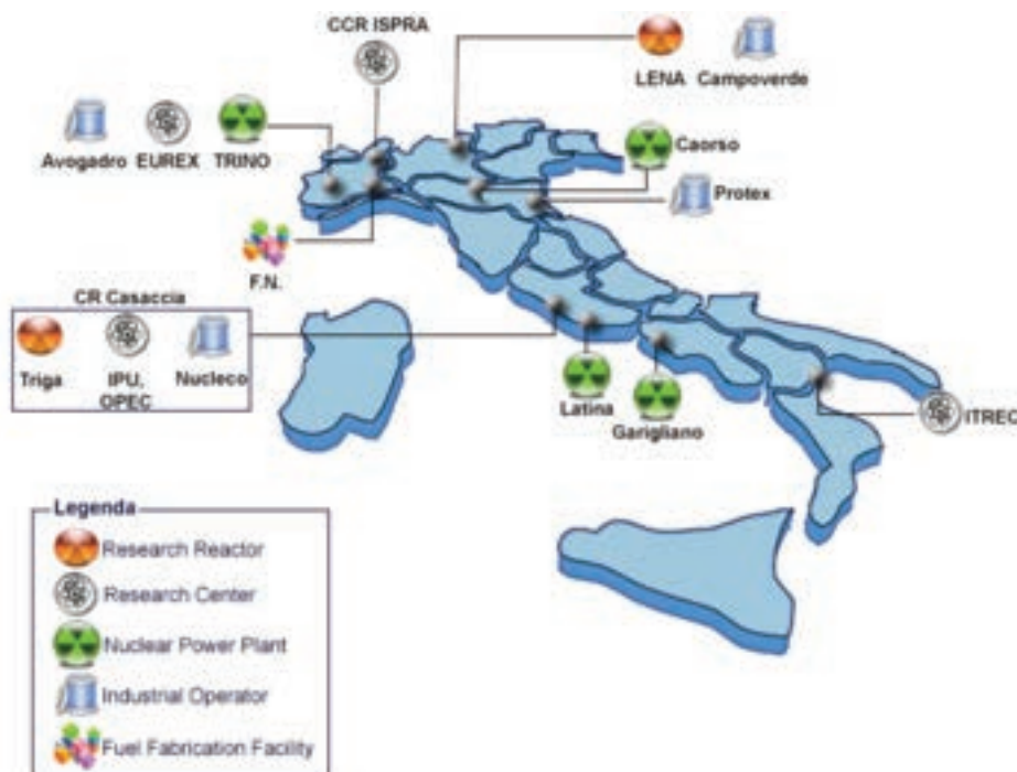
Principali siti nucleari italiani

ospitare l'insediamento, basandosi su una serie di stringenti criteri di esclusione, con un approccio che ha ancora una sua validità intrinseca, con opportuni aggiornamenti tecnici e scientifici.