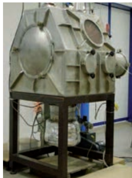
Impianto pilota Pyrel II (glove-box)

Con la terza annualità sono stati avviati studi relativi a tecniche innovative per il trattamento, condizionamento e stoccaggio dei rifiuti radioattivi, con particolare riferimento ai rifiuti attesi dai cicli del combustibile per i reattori di generazione III+ e IV (LFR/SFR). È stato approfondito lo studio di processi di separazione pirometallurgica lantanidi/attinidi, mediante prove a “freddo” di elettrorefinazione in sali fusi (impianto Pyrel II). In parallelo è stato progettato e avviata la realizzazione di un impianto per prove di elettrorefinazione con uranio depleto. È iniziato anche lo sviluppo di matrici di condizionamento per i rifiuti radioattivi provenienti dai detti processi; per le matrici vetrose/vetroceramiche si è proceduto anche alla individuazione delle fasi minerali derivanti dai processi di contenimento mediante analisi ai raggi X, spettrofotometria IR, e SEM-EDS.