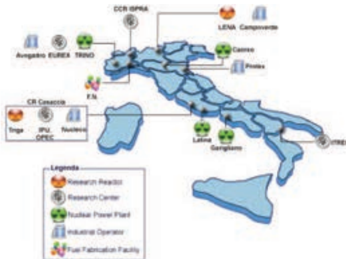
Principali siti nucleari italiani

L'ultimo "Inventario Nazionale dei Materiali Radioattivi" prodotto dalla sopra citata Task Force risale all'anno 2000. Da allora l'unico inventario disponibile è stato quello dell'ISPRA (ex APAT), che raccoglie le informazioni fornite dagli esercenti ma fornisce solo una "fotografia" dell'esistente e non effettua alcuna elaborazione dei dati ai fini dello stoccaggio definitivo. Tali elaborazioni sono state affidate ad ENEA, mediante un accordo raggiunto con ISPRA nel corso della prima annualità. L'ENEA ha elaborato i dati sui rifiuti radioattivi sulla base di ipotesi di condizionamento, laddove non già condizionati, al fine di pervenire all'inventario nazionale dei rifiuti radioattivi condizionati. Inoltre l'ENEA ha fatto una stima dei rifiuti di futura produzione da smantellamento degli impianti dismessi, basandosi sia su informazioni provenienti dagli esercenti sia su stime fatte in proprio. L'attività è proseguita nella seconda annualità con la messa a punto di un sistema informativo di gestione del data base e attualmente va avanti a regime con l'aggiornamento dei dati e l'ottimizzazione del sistema informativo denominato DBRR-SIAP. Si è iniziato ad interagire con la SOGIN per ottenere informazioni aggiornate sul programma di ge-