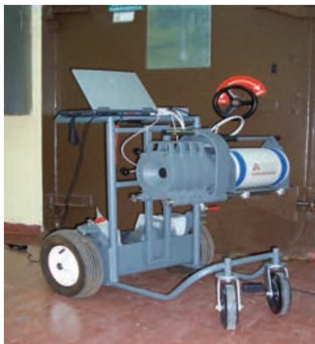
Strumento portatile per misura gamma