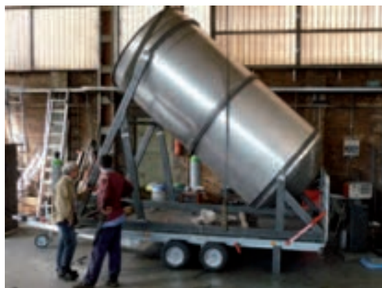
Impianto pilota di digestione anaerobica

Come aspetto innovativo è stato poi introdotto un primo stadio di digestione dedicato alla produzione di idrogeno da FORSU. Tale scelta: migliora le caratteristiche qualitative del materiale con cui alimentare il reattore metanigeno, permettendo in tal modo di raggiungere produzioni specifiche di metano maggiori rispetto a quelle ottenibili in un processo a singolo stadio; permette di ridurre la formazione di \text{H}_2\text{S} nel biogas; non necessita di particolari tecnologie/costi aggiuntivi rispetto ai digestori tradizionali; aggiunge un prodotto di