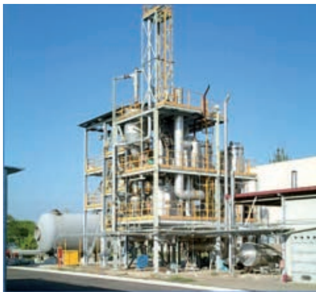
Impianto MCFC + gassificatore

Le attività hanno previsto l'approfondimento delle problematiche connesse alla gassificazione delle biomasse ligno-cellulosiche e con l'utilizzo del syngas prodotto per l'alimentazione di celle a combustibile. È stato sviluppato un modello del gassificatore che è servito per