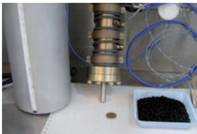
Prototipo per purificazione di una corrente di biogas di circa 0,5 \text{ Nm}^3/\text{h} , contenente 50 ppm di \text{H}_2\text{S} , per un tempo di funzionamento di circa 1500 ore

Sulla base dei risultati sperimentali ottenuti è stato progettato e realizzato un prototipo, in scala da banco, per la purificazione di una corrente di biogas in grado di alimentare una MCFC da 1 kW.