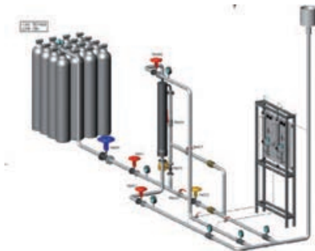
Impianto per prova moduli a membrane polimeriche

Sono stati sviluppati e sperimentati componenti innovativi per celle a combustibile MCFC più resistenti ai contaminanti, come elettrodi di nichel-cromo rivestiti con un sottile strato di ceria o ceria-zirconia. Misure di impedenza elettrochimica, misure di polarizzazione e analisi post test hanno mostrato che gli elettrodi ricoperti