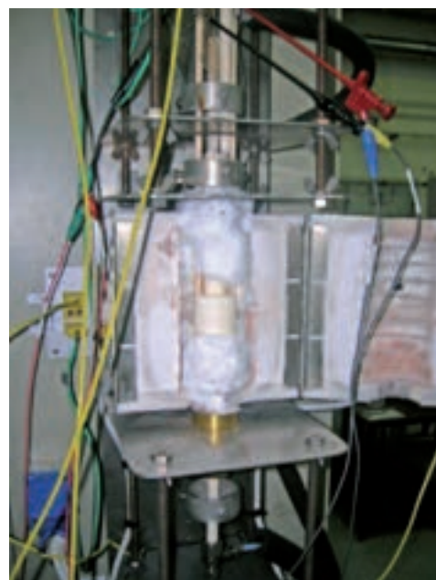
Impianto per la caratterizzazione di elettrodi con area 3 cm 2