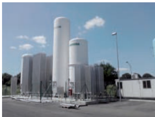
Sezione gas tecnici di supporto

Molti lavori saranno presentati a Roma durante la conferenza EFC11 (14-16/12/2011), di cui l'ENEA e l'Università di Perugia sono i promotori. ENEA, CNR e RSE hanno organizzato per il 13/12/2011, come evento collaterale, una giornata dedicata alla presentazione delle attività italiane in ambito idrogeno e celle a combustibile. La giornata sarà dedicata sia alle attività di ENEA, CNR e RSE nell'ambito dell'AdP che a interventi da parte delle industrie italiane attive nel settore H 2 e FC.