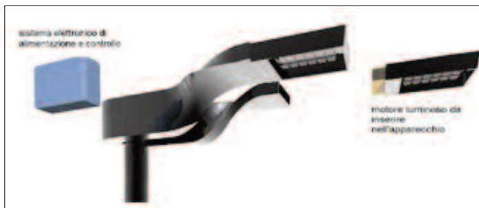
PLUS: una possibile configurazione

Il design del modulo e del sistema modulare prevede la distinzione in più componenti o blocchi logici funzionali del sistema di illuminazione ("design by components") per ottenere un sistema riconfigurabile, flessibile, facilmente manutenibile e con una forma funzionale estremamente nuova rispetto alla tradizione.