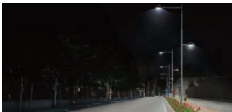
Il nuovo impianto di via Roma a Marcallo con Casone