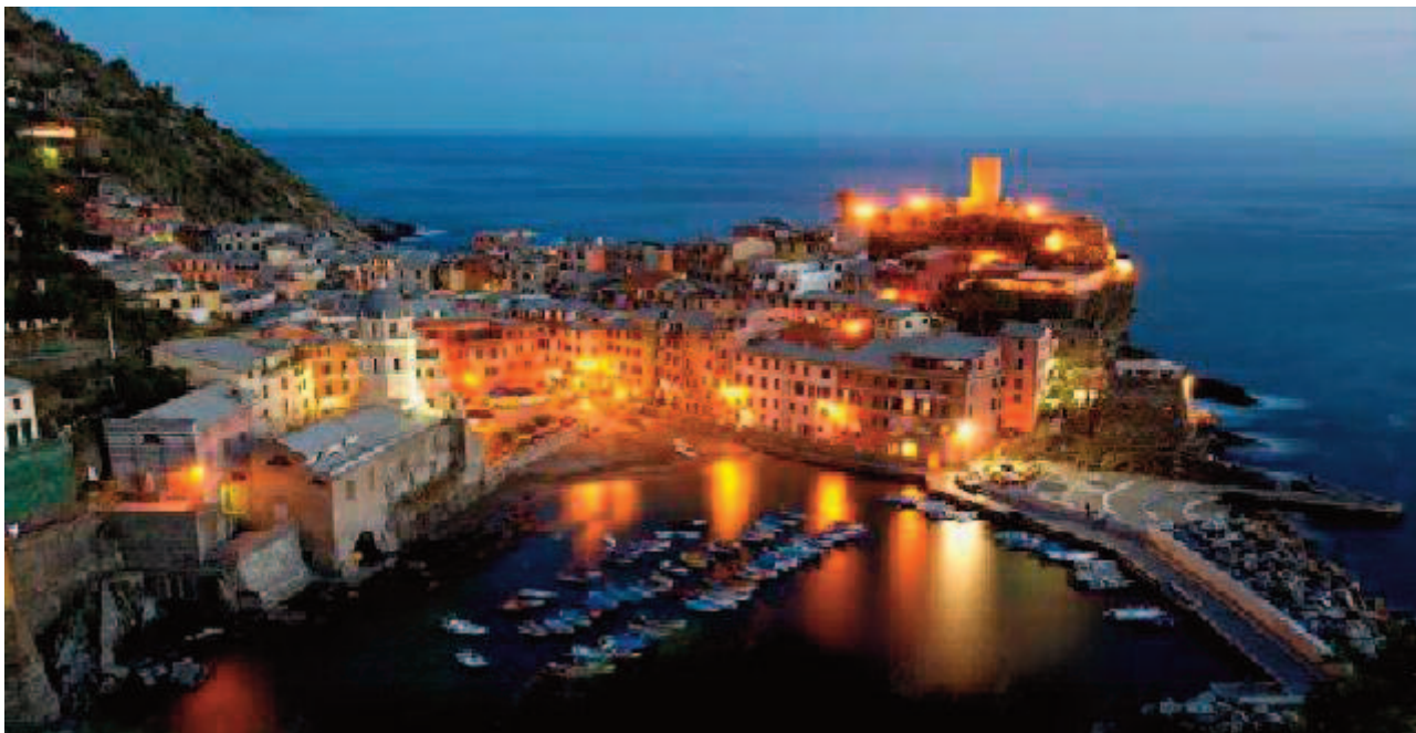
Illuminazione notturna del Comune di Vernazza

Si è iniziato a impostare il percorso verso la trasformazione dei Comuni in città smart.