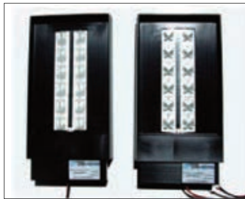
PLUS: prototipi realizzati

Sono proseguite le attività sperimentali su STAPELIA, apparecchio fotovoltaico a LED brevetto ENEA.