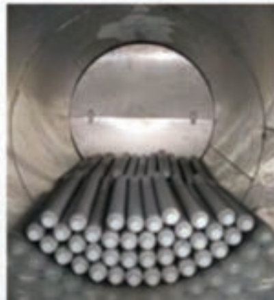
Sistema di accumulo PCM, vista dall'alto del serbatoio

sperimentale del funzionamento di prototipi di componenti costituenti il sistema integrato in grado di assolvere l'intero compito della climatizzazione sia estiva che invernale. È stato quindi integrato nell'impianto di solar heating & cooling a servizio dell'edificio F92 del CR Casaccia un accumulo termico a cambiamento di fase (PCM) ed effettuata una campagna di prove sperimentali di un impianto di solar cooling a servizio di una serra per colture intensive; sono state sviluppate logiche di regolazione progettate ad hoc per impianti di solar heating & cooling e per impianti a pompa di calore a compressione e per finire è stata effettuata l'analisi di sensibilità del sistema per stabilire, ai fini dell'effettiva fattibilità economica, le soglie di costo iniziale dei vari componenti degli impianti sperimentali.