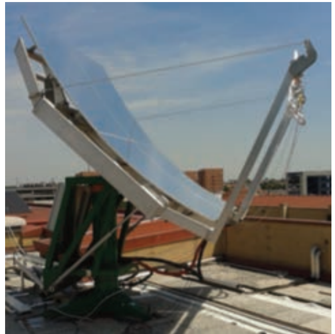
Prototipo di concentratore solare a specchi parabolici con inseguimento su due assi con fuoco lineare

Riguardo le facility per la caratterizzazione di componenti solari per applicazioni a media e alta temperatura, sono state effettuate l'analisi sperimentale e la qualificazione di componenti solari a concentrazione