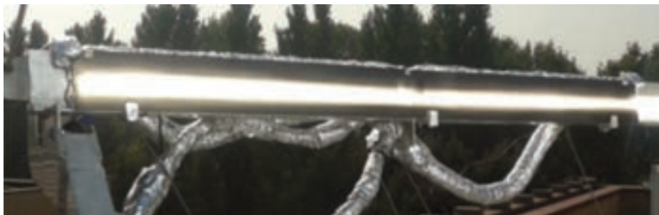
Prototipo di ricevitore termico a minicanali, installato sul concentratore, durante una prova

ottimizzati per applicazioni a media temperatura e la messa a punto della facility di test per prove indoor su collettori solari. In particolare le attività si sono focalizzate su: sperimentazione e qualifica di componenti solari a concentrazione ottimizzati per applicazioni distribuite di piccola taglia a media temperatura, specialmente nei settori industriale, commerciale e terziario; studi per valutare le potenzialità di applicazione di sistemi co- e tri-generativi di piccola taglia che utilizzano mini e micro CSP abbinati a cicli a fluido organico (ORC); messa a punto della facility di test per prove indoor su collettori solari, implementando un sistema (“cielo artificiale”) in grado di riprodurre lo scambio radiativo nell’infrarosso che avviene tra un collettore e la volta celeste nelle ore di insolazione.